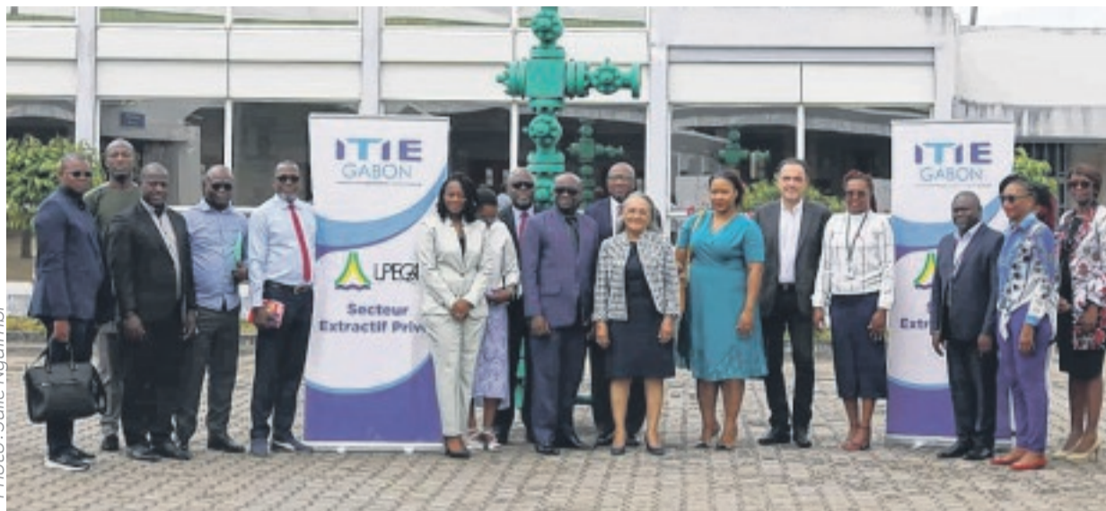
Quelques participants à l'ouverture des travaux de l'ITIE.